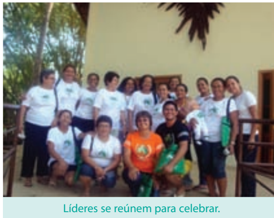
Líderes se reúnem para celebrar.

Aconteceu, também, a capacitação para capacitadores em Saúde Bucal, Alimentação Saudável e Hortas Caseiras, Brinquedos e Brincadeiras. Em todos os ramos muitas ações importantes aconteceram. Na Paróquia São Sebastião, de Rio Branco, aconteceram os encontros de grupos de gestantes, capacitação em saúde bucal e brinquedos e brincadeiras dentre outras ações. A Paróquia Bom Jesus, de