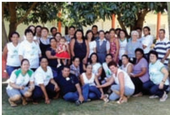
Líderes animados com a missão da Pastoral da Criança.

Em 2009, realizamos a Assembleia Diocesana, que contou com a participação dos Ramos. Durante a assembleia foi feita a