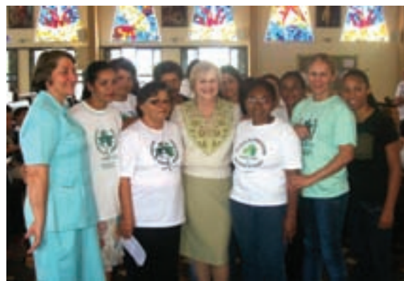
Pastoral da Criança comemora 20 anos no Distrito Federal.

Realizamos uma linda missa em Ação de Graças, presidida por Dom João Braz de Aviz, Arcebispo de Brasília, no Santuário Nossa Senhora de Fátima. Para completar a nossa alegria, contamos com a presença da Dra. Zilda Arns Neumann, coordenadora Internacional da Pastoral da Criança, que nos parabenizou por toda coragem em lutar em favor da vida levando às famílias, crianças e comunidades toda a nossa dedicação, amor, esperança e luz na vida de tantos irmãos que clamam por justiça. Em seguida, os líderes receberam na Câmara