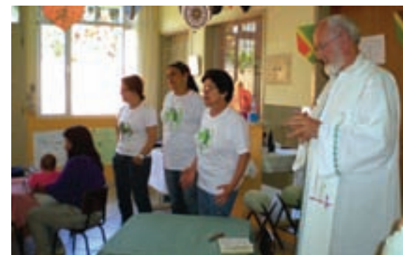
Líderes acompanham a comunidade em Garopaba.

Hoje, após seis anos, a Pastoral da Criança