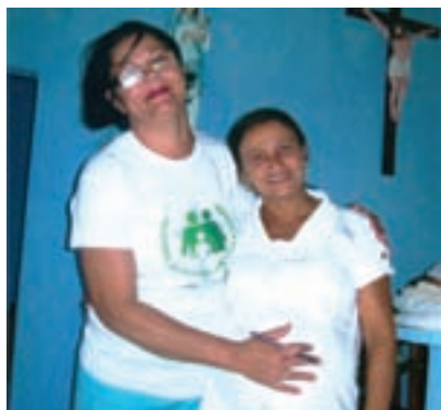
Líder no acompanhamento às gestantes.

As líderes do Ramo Nossa Senhora da Boa Hora, Arquidiocese de Aracaju, estão realizando um excelente trabalho junto às gestantes de suas comunidades.